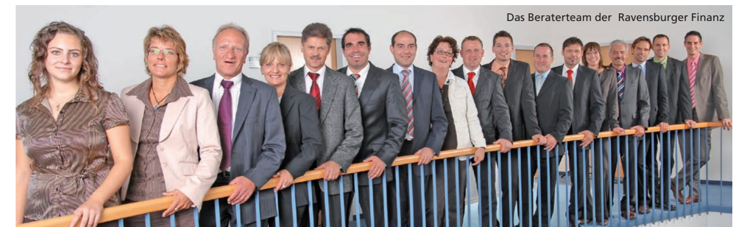
Das Beraterteam der Ravensburger Finanz

Verbesserungsvorschläge oder konkrete Themenwünsche – schließlich machen wir den Newsletter für Sie und nicht für uns. Wenn Sie also eine Idee oder Anregungen haben rufen Sie uns an oder senden Sie uns eine Mail an info@rv-finanz.de